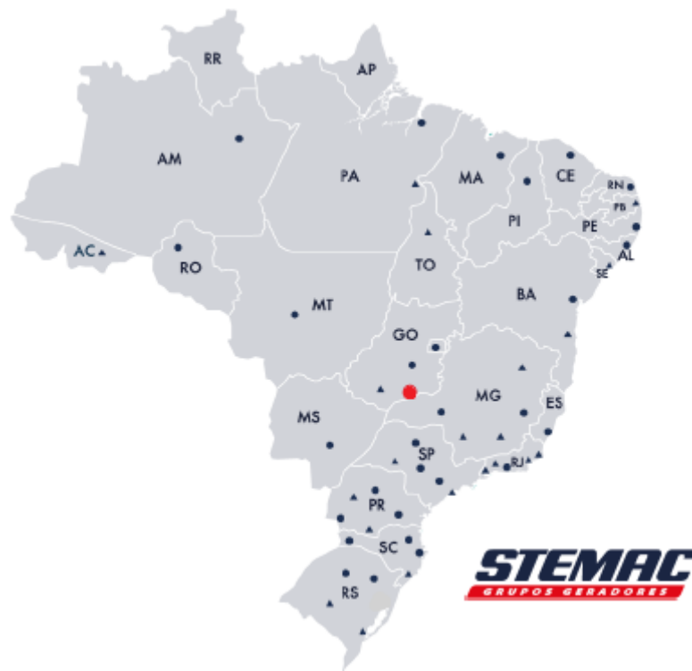
Estados atendidos pelo Grupo Stemac

Não fosse o bastante, o Grupo Stemac hoje exporta para países de 4 continentes e recebe matérias-primas de fornecedores não só do Brasil, como também de outros países, como Estados Unidos, Suécia, Alemanha e Inglaterra. Atualmente, o Grupo Stemac é um dos únicos grupos empresariais do mundo com capital exclusivamente nacional, liderando esse segmento industrial no país e superando gigantes multinacionais como Caterpillar e Cummins. Além de