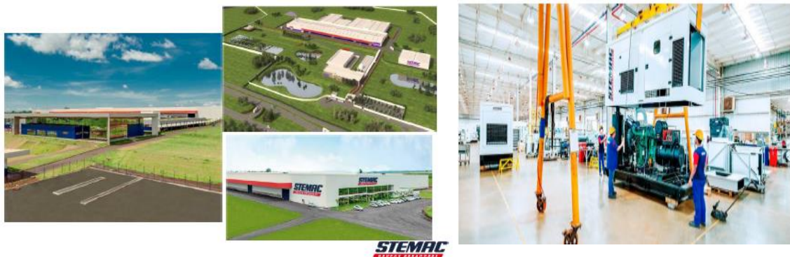
Parque Fabril do Grupo Stamac, localizado em Itumbiara

A fábrica de grupos geradores do Grupo Stamac é uma das instalações fabris mais modernas do estado, capaz de produzir grandes volumes de grupos geradores para atender a todo tipo de demanda. Está localizada ao lado do centro de distribuição do Grupo Stamac, que unificou as operações de distribuição e, semelhantemente ao próprio parque fabril, pôs fim às operações pulverizadas que o Grupo