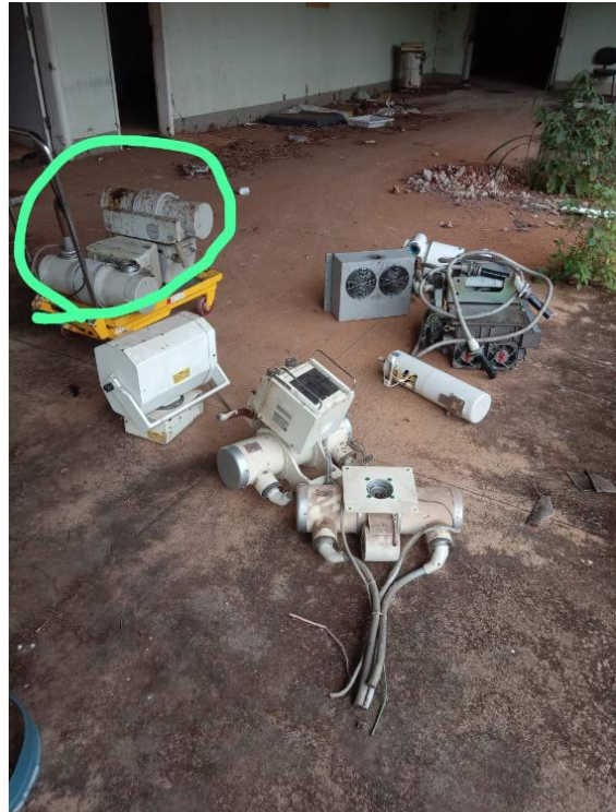
Raio X Philips