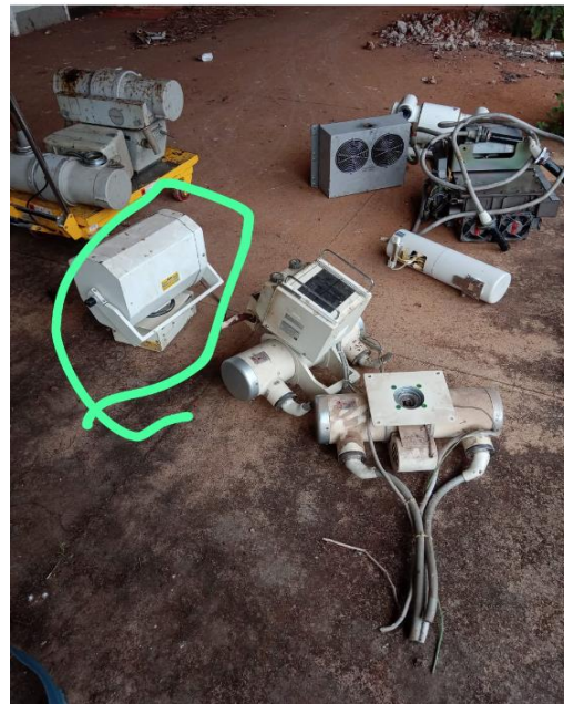
Raio X móvel